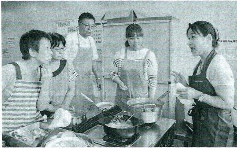
地元産の農作物を使った料理に挑戦した教室

【剣淵】町が特産化を目指す南米原産の穀物キヌアや町産野菜を使った料理教室が、町健康福祉総合センターで開かれた。町民14人が参加し、ジャガイモやズッキーニなど夏野菜のグラ